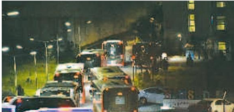
40'a yakın otobüse bindirilen öğrenciler Atakum ilçesinde bulunan Kredi ve Yurtlar Kurumu 'na bağlı Münevver Ayaşlı Kız Yurtlarına yerleştirildi.