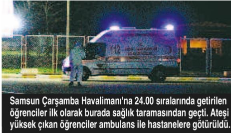
Samsun Çarşamba Havalimanı'na 24.00 sıralarında getirilen öğrenciler ilk olarak burada sağlık taramasından geçti. Ateşi yüksek çıkan öğrenciler ambulans ile hastanelere götürüldü.